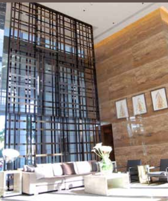
Interiores do Apogee em South Beach por Yabu Pushelberg