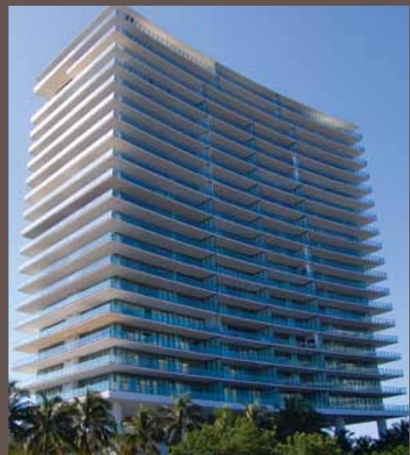
Apogee em South Beach por Sieger Suarez