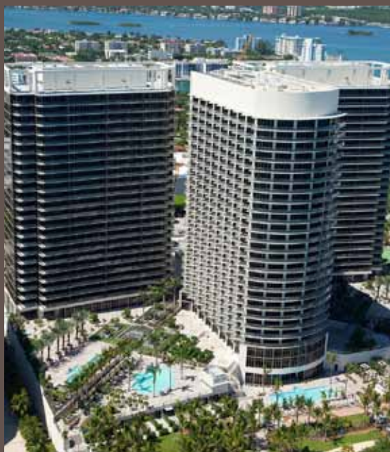
St. Regis Bal Harbour por Sieger Suarez