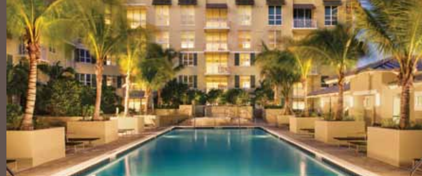
City Palms em Downtown West Palm Beach por Newgard Development Group