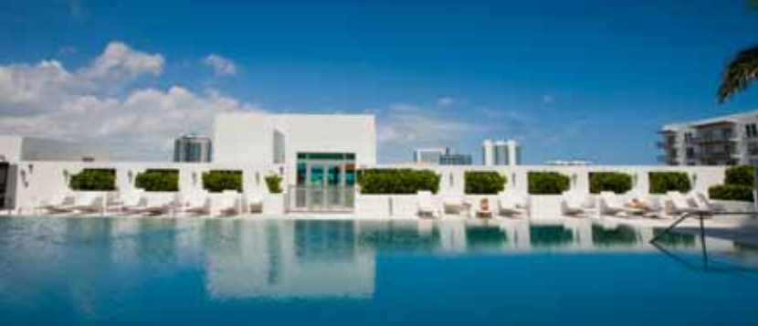
Gallery Art no Miami Design District por Newgard Development Group